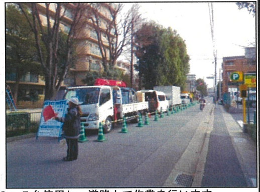
作業車 (2 t ~ 4 t) を約 3 ~ 5 台使用し、道路上で作業を行います。