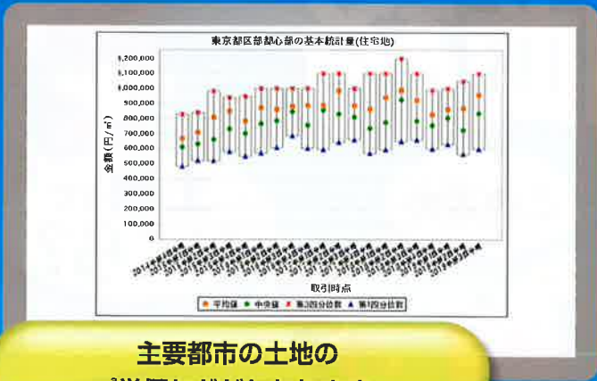
主要都市の土地の ㎡単価などがわかります。

https://www.land.mlit.go.jp/webland/basicStatistic.html