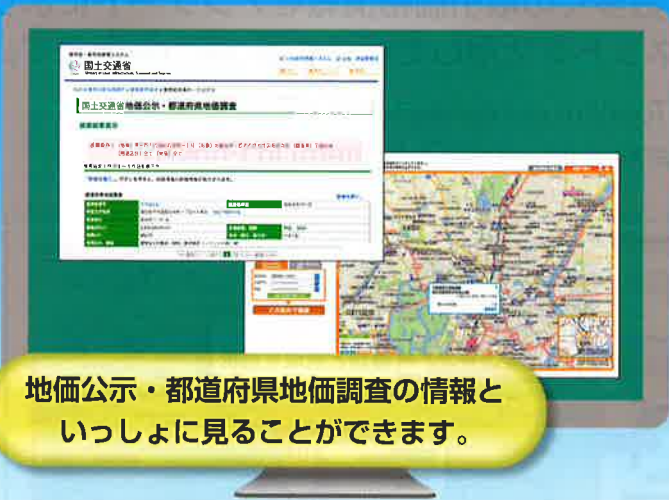
地価公示・都道府県地価調査の情報と いっしょに見ることができます。

https://www.land.mlit.go.jp/webland/download.html