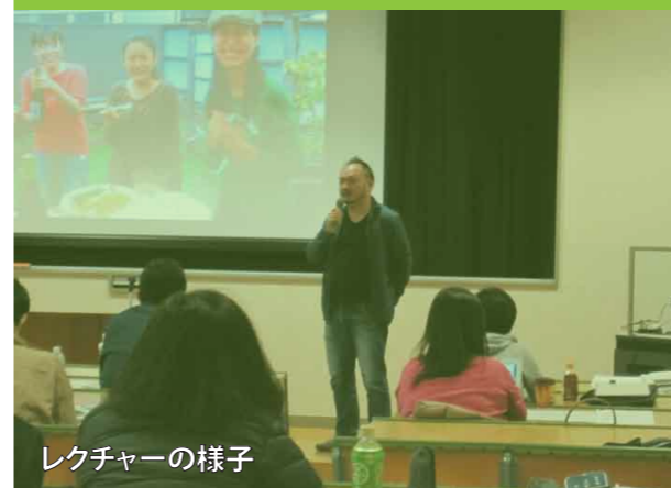
レクチャーの様子