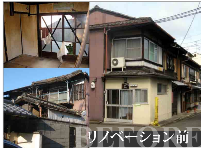
リノベーション前 京都の町家