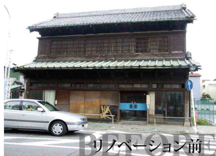
リノベーション前 旧魚網問屋(築83年)