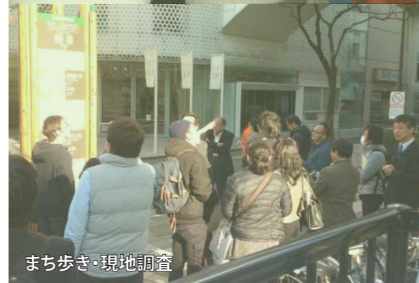
まち歩き・現地調査