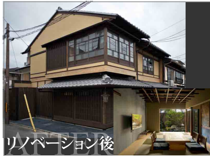
リノベーション後 旅庵 然(旅館)