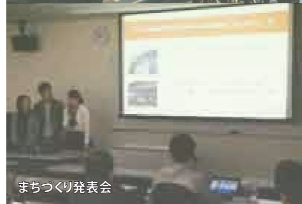
まちづくり発表会