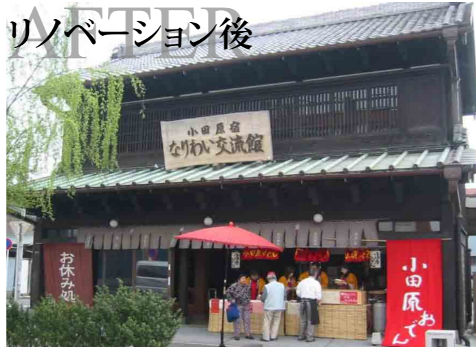
リノベーション後 小田原宿なりわい交流館

このセミナーは国土交通省都市局の「民間まちづくり活動促進事業」の一環として実施するものです