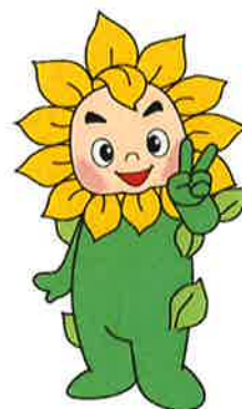
兵庫県弁護士会 イメージキャラクター ヒマリオン